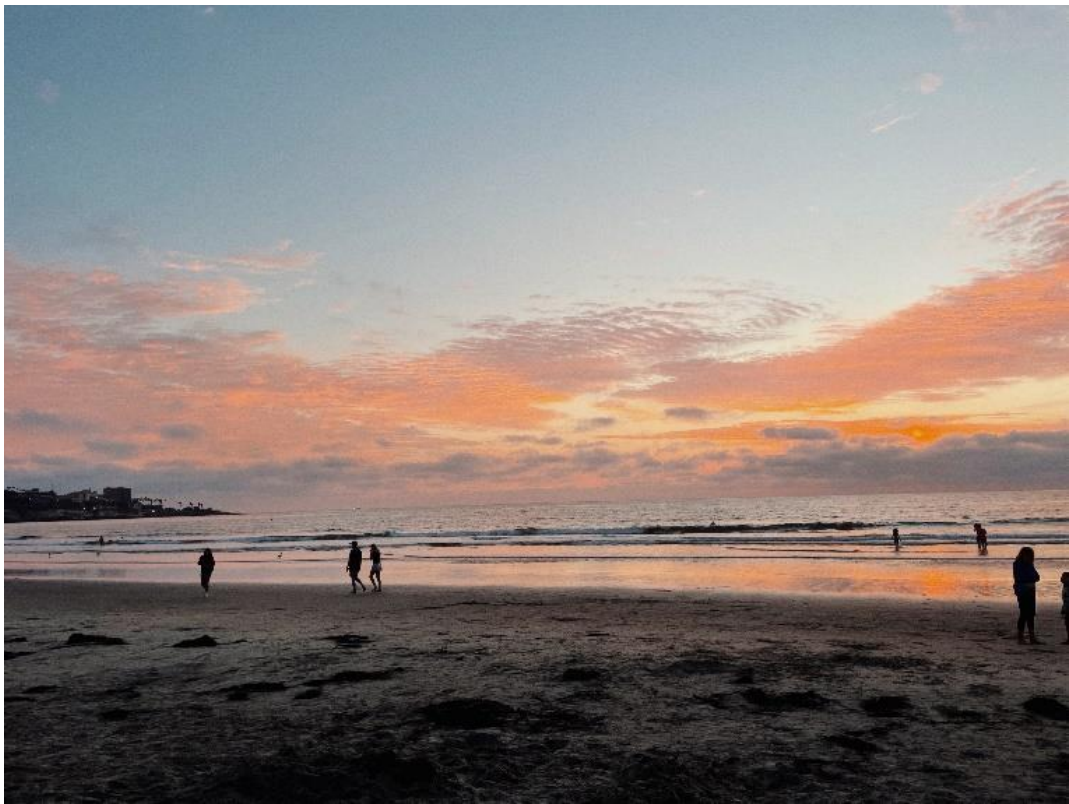
▲ La Jolla shores beach 夕陽