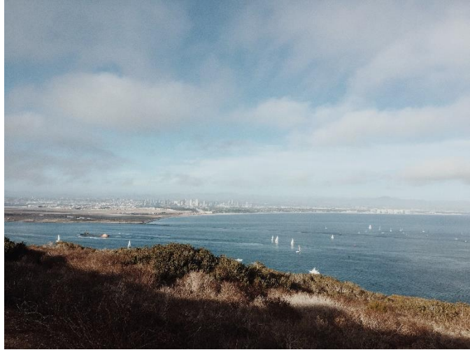
▲ Point Loma 燈塔、海景