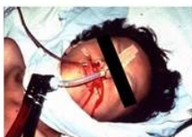
登革熱重症患者