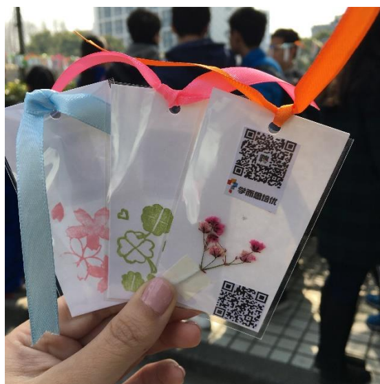
社團活動集點護照(右)